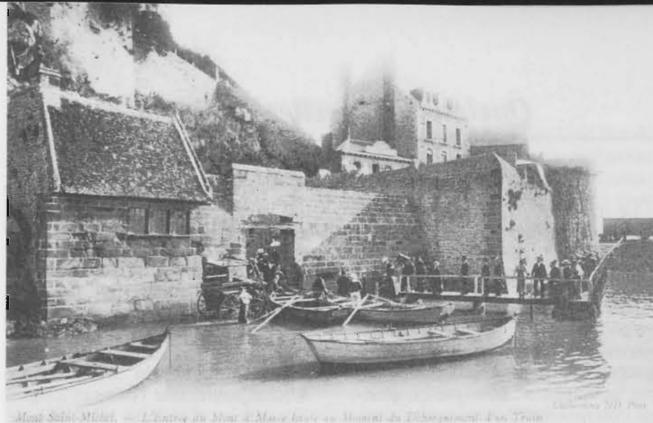
Mont-Saint-Michel. — L'entrée du Mont à Marée basse au Moment du Débarquement d'un Train.