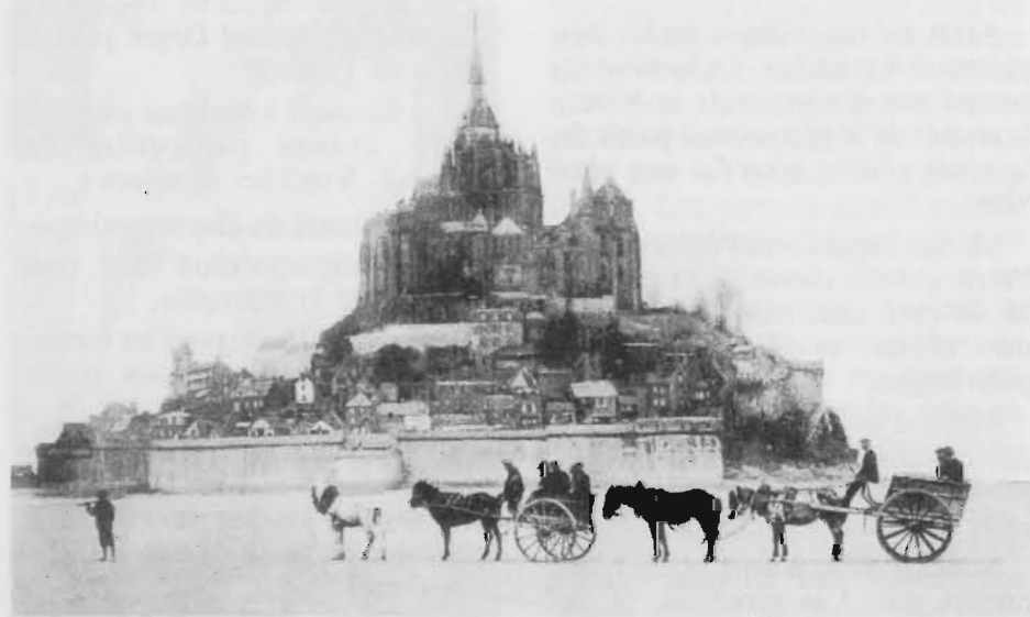
31 LE MONT-SAINT-MICHEL. — Les Voitures du Goulet. — H.L.