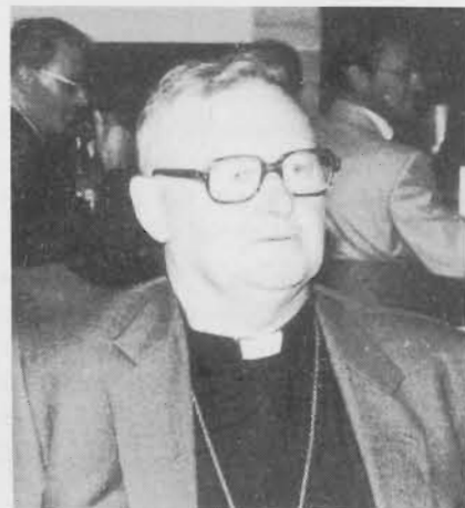
Image de leurs deux visages confondus dans le sien.

L'Assemblée plénière des évêques de France Lourdes, 7 novembre 1993