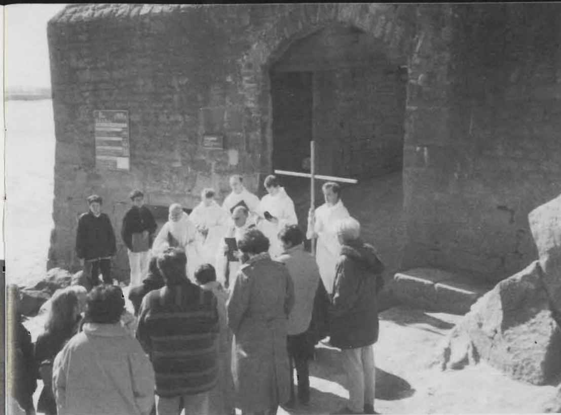
Le chemin de croix depuis l'entrée de la ville jusqu'à l'église Saint-Pierre