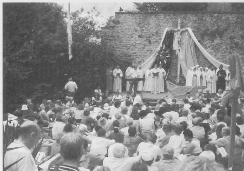
Une assemblée priante, devant le pasteur qui les accompagnait: Mgr FIHEY.