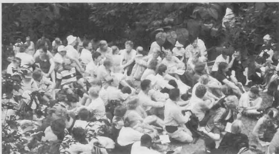
Après leur traversée, les 1 500 pèlerins se retrouvent, à la croix de Jérusalem. Encore un peu de temps pour se connaître avant de célébrer les vêpres.