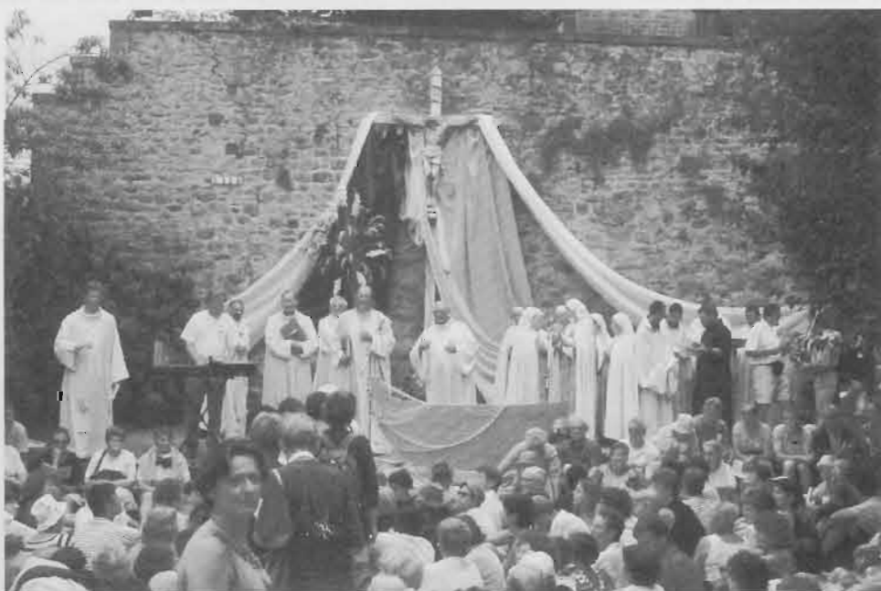
Les dernières répétitions et mise en place avant de commencer.