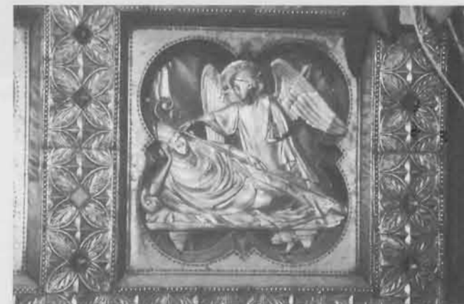
Le songe d'Aubert : Église St Pierre du Mont-Saint-Michel