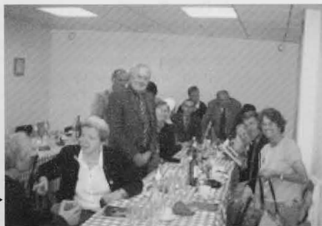
▶ Rencontre des Montois et des amis de St Michaël's Collège à la salle St Aubert.