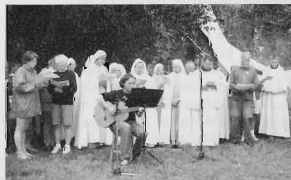
La célébration des Vêpres avec la Fraternité monastique de Jérusalem et l'atelier chant qui avait travaillé les psaumes de cet office.

— toi, tu es élevé pour toujours, Yahvé. Voici : tes ennemis périssent, tous les malfaisants se dispersent ; tu me donnes la vigueur du taureau, tu répands sur moi l'huile fraîche ; mon œil a vu ceux qui m'épiaient, mes oreilles ont entendu les méchants. Le juste poussera comme un palmier, il grandira comme un cèdre du Liban. Plantés dans la maison de Yahvé, ils pousseront dans les parvis de notre Dieu. Dans la vieillesse encore ils portent fruit, ils restent frais et florissants, pour publier que Yahvé est droit : mon Rocher, en lui rien de faux.