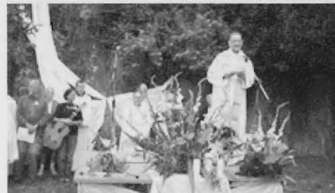
En clôture du pèlerinage, Monseigneur FIHEY.