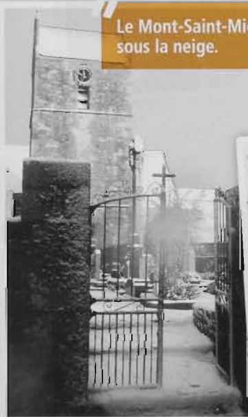
Le Mont-Saint-Michel sous la neige.

Brest; 28 mars: pour les rameaux, groupe antillais de Madame Cyrille.