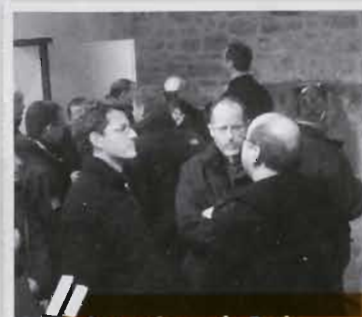
Les prêtres de Paris.