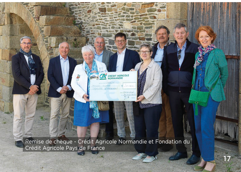
Remise de chèque - Crédit Agricole Normandie et Fondation du Crédit Agricole Pays de France