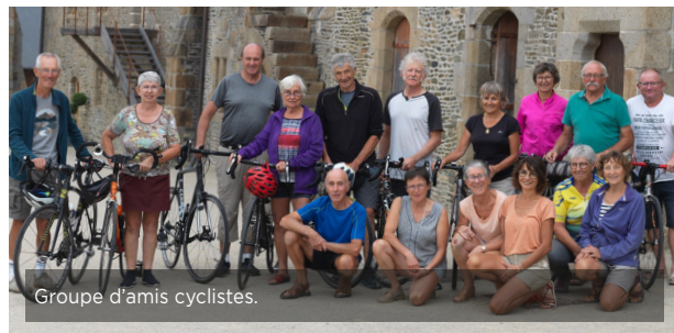
Groupe d'amis cyclistes.