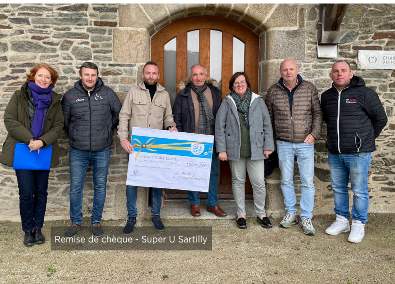
Remise de chèque - Super U Sartilly