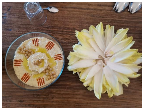
Franchement, notre cuisine, c'est la meilleure du monde – modestie mise à part !