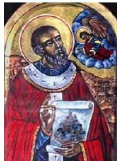
Songe Saint Aubert

Dieu parle parfois aux hommes à travers des messagers angéliques. Il l'a fait tout au long de l'histoire biblique et continue à le faire aujourd'hui. Si le Mont est aujourd'hui ce haut lieu spirituel, c'est parce que Saint Michel a demandé en songe à l'évêque Aubert d'y bâtir un sanctuaire qui lui soit consacré.